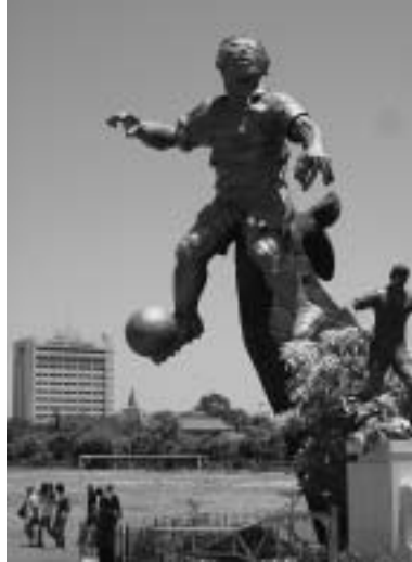
写真2 カルボンにそびえるラマンの銅像

どその賞賛の度合いが大きいという印象を受けた。「彼こそは天性の才能 ( bakat alam ) の持ち主。並はずれている ( luar biasa ), 真の天才 ( jenius )…」こうした言葉を、筆者はマカッサルで何度聞いたか分からない。そしてこの評価は決して地元マカッサルだけにとどまるものではない。筆者は念のためにジャカルタで、ジャワ人の PSSI 役員の人々に対してもラマンについての質問を試みたが「そうだね、彼はひとつの伝説 ( legenda ) だからね」と、苦笑いしながらもラマンがインドネシア史上最高の選手であることを認めたものだった。2004年7月には彼の業績を称え、ジャカルタの名門トリサクティ大学が、新しいスタジアムにラマンの名を冠することを決めた。