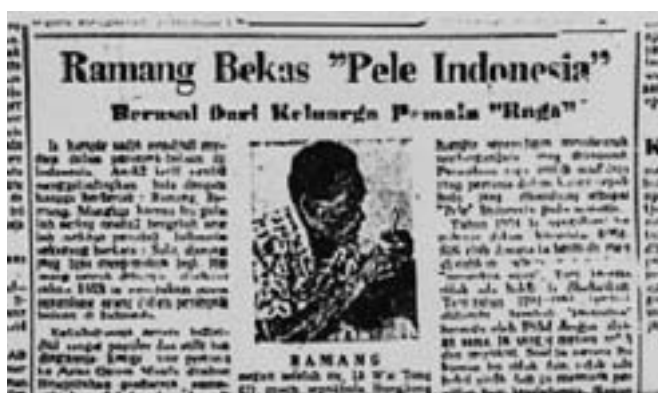
写真3 ラマン, 元『インドネシアのペレ』[Kompas, November 4, 1970]