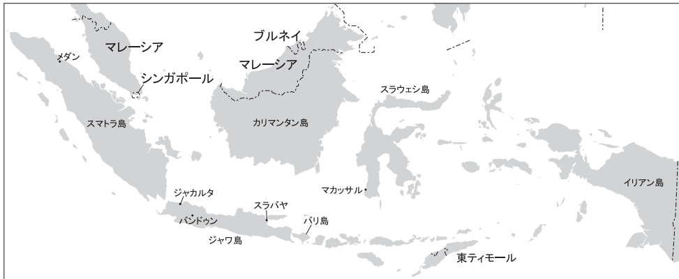
図1 インドネシア地図

エリートの存在を背景に、ジャワに対する優越意識もあり、結果いまだに独立しようという動きすらまれに起こる。彼らはアンビバレントな感情を抱いているのである。