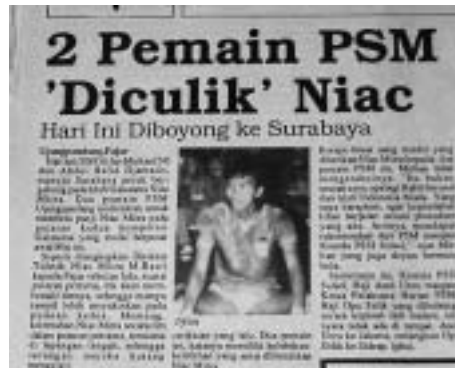
写真6 PSMの2選手がニアクに「盗られた」[Fajar, April 30, 1990] ニアクとは、スラバヤに本拠を置くガラタマのチーム Niac Mitra のこと。