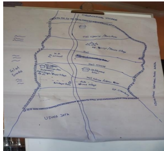
タマンジャヤ村概略図