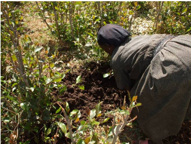
phooto 1 : Dikee maasaa caattii buusan

Ummani giddu-galeessa baddaa Itiyooophiyaa keessa jiraatu haalli jireenya isaa kan inni hundaa'ee qonna aadaa irratti, keessumattuu looni horsiisuu waliin kan wal-qabatedha. Ummanni looni (sangoota) hojii qonnaaf baayyeetti fayyadama. Qonna-sangaa naannoo kanatti hoomisha midhaaniif kan of-danda'e dha, maasaan (oyiruu) qonnaa xiqqaa ta'us. Kanaaf, Naannoo kanatti, looni qonnaaf akka qabeenya baayyee barbaachisaatti ilaalamu. Looni fayidaa adda-addaa qabu. Looni haalli jireenyaa kan irratti hundaa'e faayidaa kan armaan gadii kennu, isaanis: 1) Dikee midhaan hoomishuuf ta'u kennu (phooto 1) 2) Nyaata kennu kan akka aannanii, foonii (phooto 2), fi kkf, 3) Qonnaa fi baraayiiif (miidhaan sukkuumuu) fayyadu (phooto 3), 4) Wayitii barbaachisaa ta'e akka madda galiitti ni fayyadu. Looni haala qabeenya namaa (dureessummaa) ibsuuf akkasumas akka kabaja qonnaan bulootaattilee ni ilaalamu.