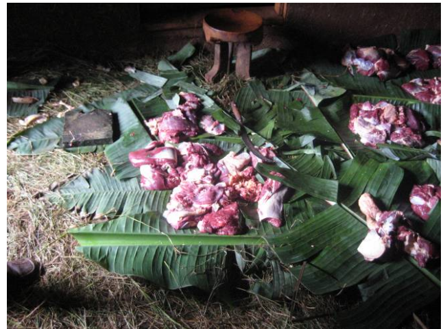
phooto 2 : Fooni qoodmaf qophaee jru mudhissa